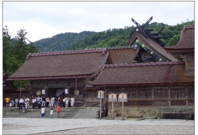
②出雲大社（いづもおおやしろ）参拝