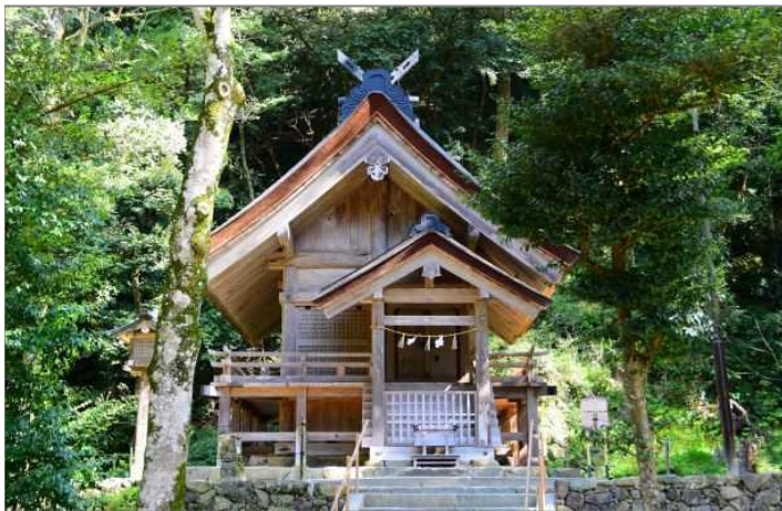
③素鷲社（そがのやしろ）稲佐の浜の砂を奉納し、社の砂を戴きます。