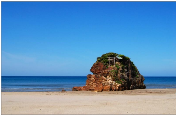
①稲佐の浜（いなさのはま）奉納の砂入れを準備。旧暦の10月10日に神迎神事が執り行われる浜。

ご要望に沿った、女性部厳選のプランをご紹介します！ 事前にご遠慮なくご相談ください！